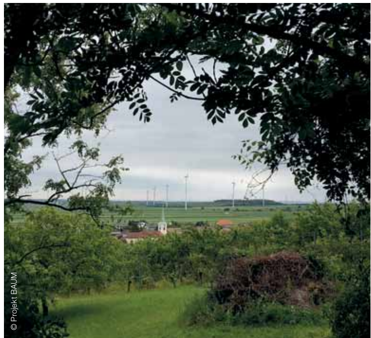
Trojhraničný bod AT-SK-HU Dreiländereck AT-SK-HU