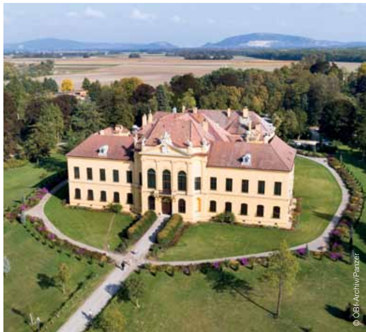
Zámok Eckartsau na Moravskom poli Schloss Eckartsau im Marchfeld