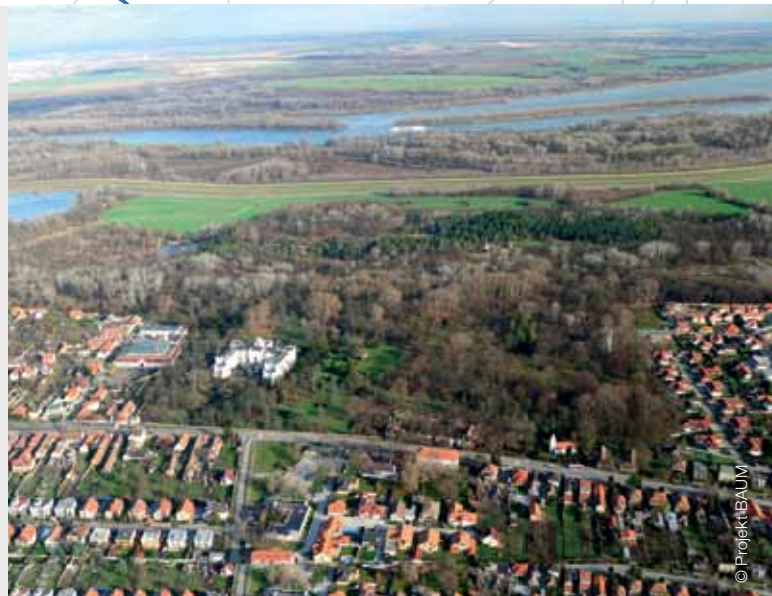
Bratislava – mestská časť Rusovce