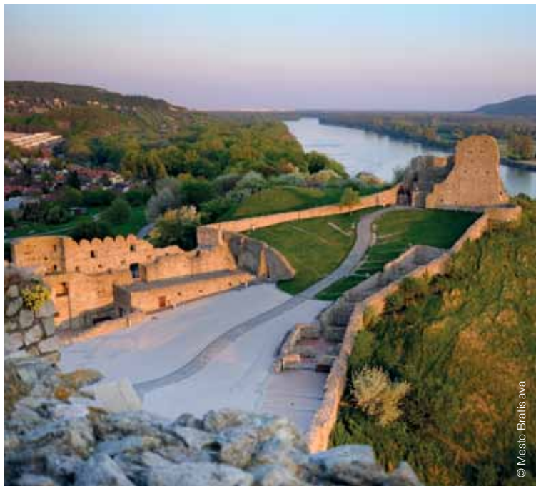
Hrad Devín na sútoku Moravy a Dunaja Burg Devín am Zusammenfluss von March und Donau